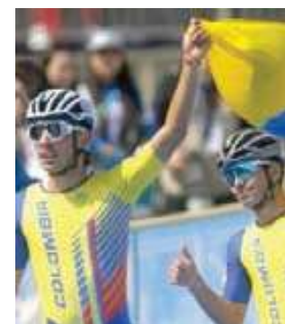
Barranquilla no podrá ser sede de los Panamericanos.

Complicación. Colombia ha sufrido un revés significativo al perder la sede de los Juegos Panamericanos 2027, que originalmente estaban programados para llevarse a cabo en Barranquilla. La decisión se tomó debido a la falta de cumplimiento por parte del país en relación con los pagos acordados con Pa-