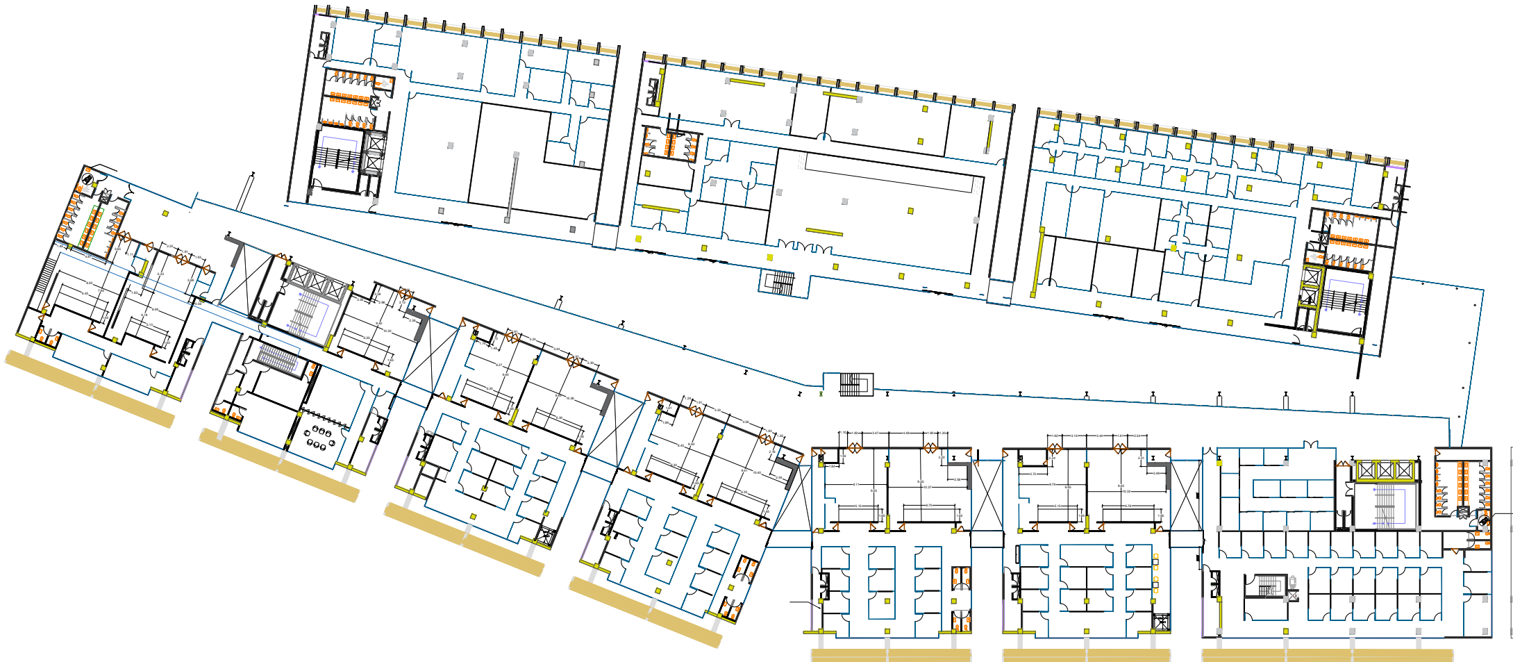
3er NIVEL SDE Dimensionada