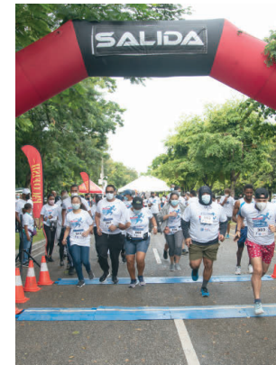
Inicio del maratón.

“Se estima que esta cantidad puede aumentar a 23.6