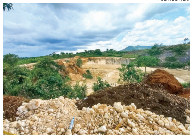
Lugar donde se pretende construir el vertedero.

Apuntó que ese sector tiene la particularidad de que es el único turismo regional que depende exclusivamente de aguas subterráneas suplidas por unos 150 pozos perforados en las rocas calizas coralinas y porosas que se recargan con frecuentes lluvias gracias a un drenaje