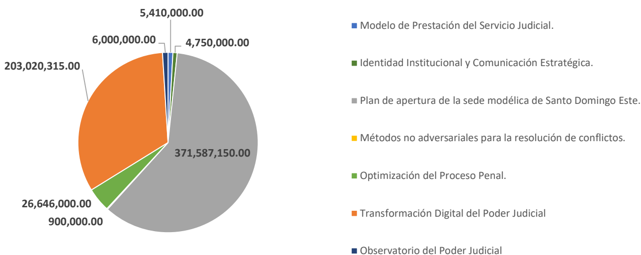
Gráfico No. 9: Distribución presupuestaria de los proyectos por Área Responsable